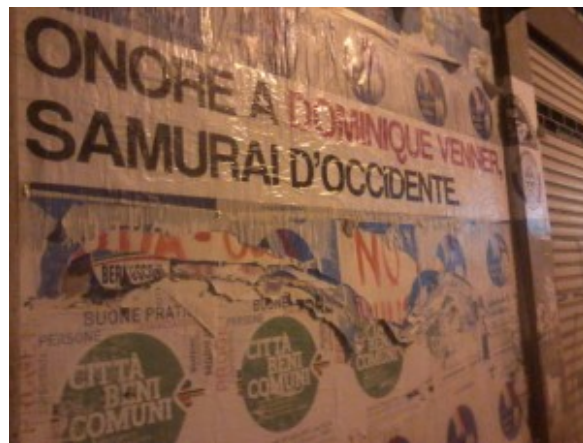
Casa Pound inneggia a Dominique Venner

Eppure ho dovuto ricredermi quando ho letto che c'è chi lo considera un martire e lo ha "omaggiato" in tutta Italia, senza distinzione di nord-sud questa volta. Sempre la stessa gentaglia sparsa ovunque, come metastasi del nostro bellissimo paese.